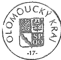
Ing. Zdeněk Švec náměstek hejtmána Olomouckého kraje